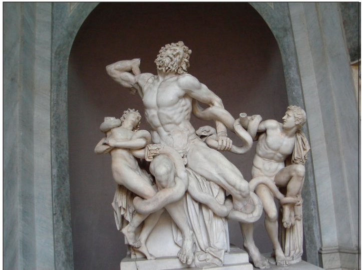
Els mites permetien explicar el món a base de criatures fantàstiques com la serp marina que està devorant a Laocont i els seus fills aci dalt.

Passarem ara a introduir el pensament bàsic d'aquestos primers filòsofs presocràtics: