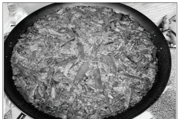
La tradició o el saber popular no necessita de principis científics per a obtenir bons resultats.