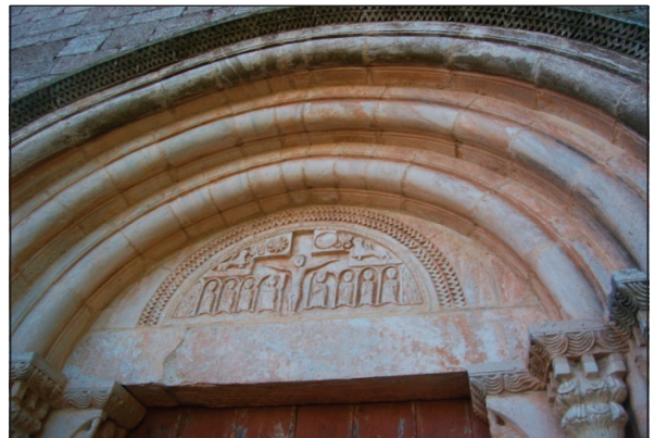
La religió suposa ficar-se davant d'allò sobrenatural.

h) Tradició: Enunciats basats en l'experiència col·lectiva de la gent après els segles i que tot i que sovint reflecteix prou bé la realitat, sol ser imprecisa i inexacta quan no és rematadament falsa. Exemples "Vent de mestral, ni peix ni pardal", "Home roig i gos pelut, més val mort que conegut", "Cal tallar les canyes en luna nova", "Les dones que menstruen no deuen cuinar".