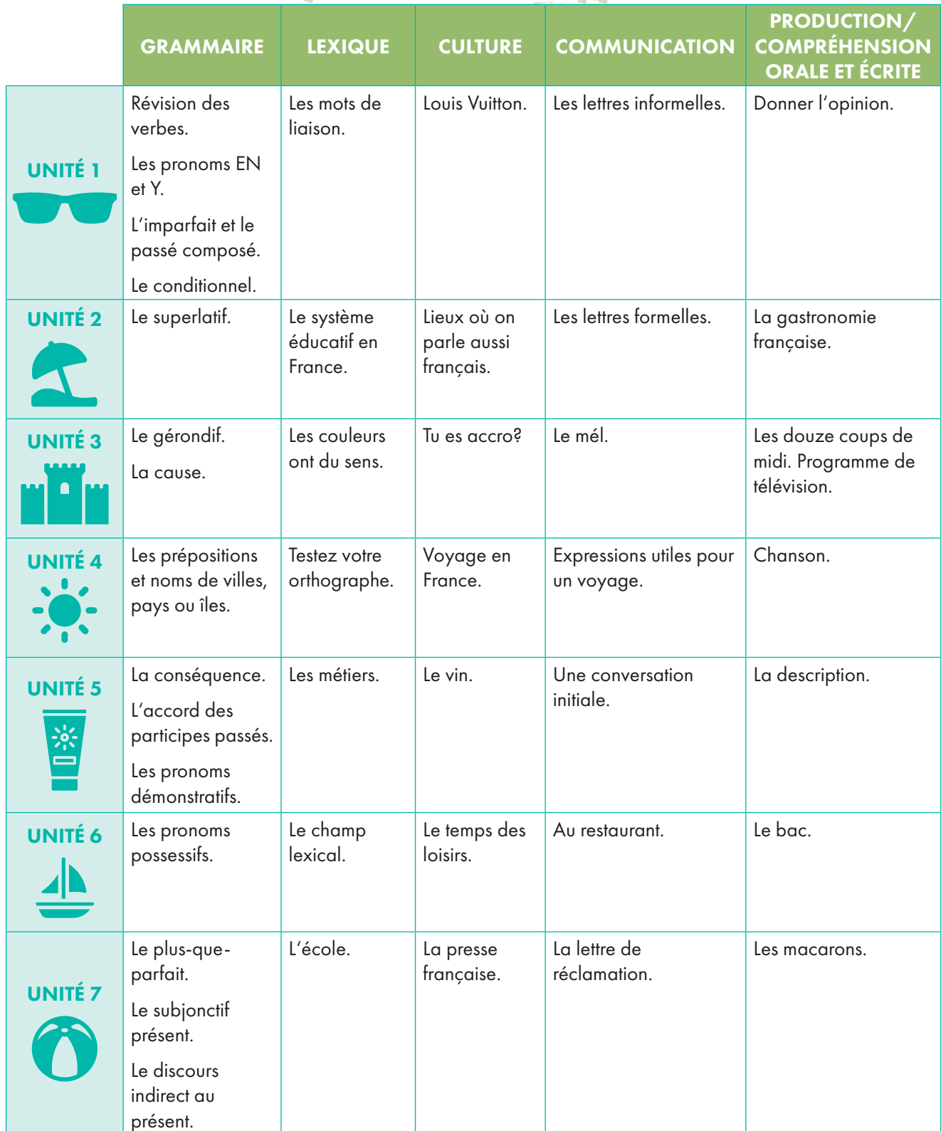
Tableau des contenus