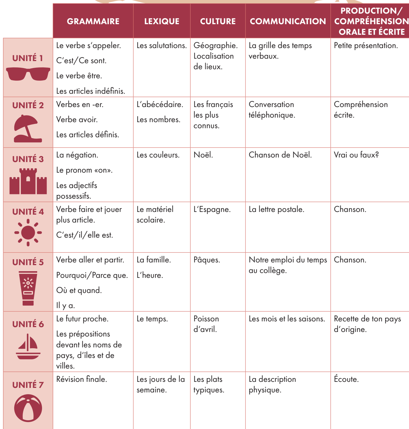
Tableau des contenus